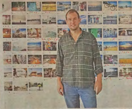
"תשוקה את תשוקה, וצילום זה מה שרציתי לעשות." בירן | צילום: יעל טנדלור