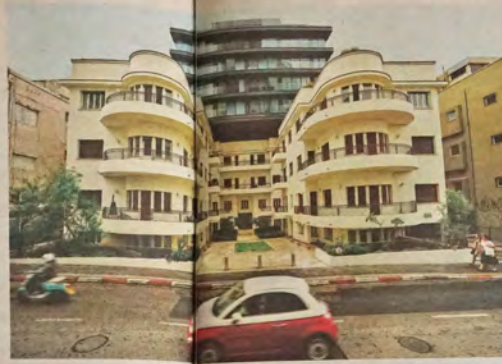
"דטרו מדורתי, זה הכריים שחיכיתי לו." הירקון 96