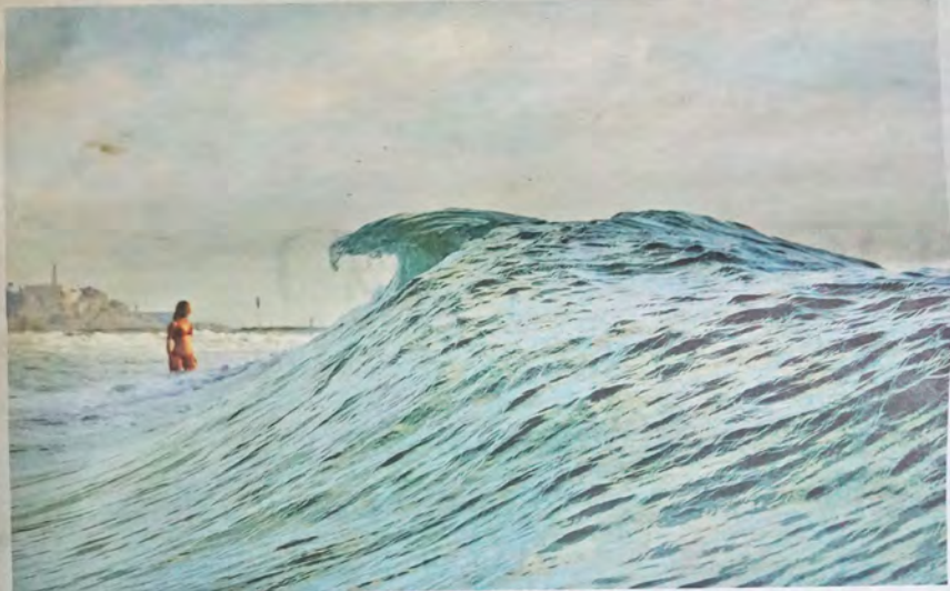
"חלק מפייסבוק עירונ". גל בים

למעשה אתה יושב ומבטח. "כן ולא. השיטה שלי היא קודם כולל להגדיר פריים ואחר כך לתת להתרחשות ליצור את התמונה. ציי למתי למשל את הרושני 12 ורעתי שאני רוצה לצלם את החלק הרחבני של בית הקפה שאנשים יושבים בו בזמן אנשים ומכוניות תולפים כפריים. כסף הקליק הארוב עליי היה ורויקס הירקנית הלא