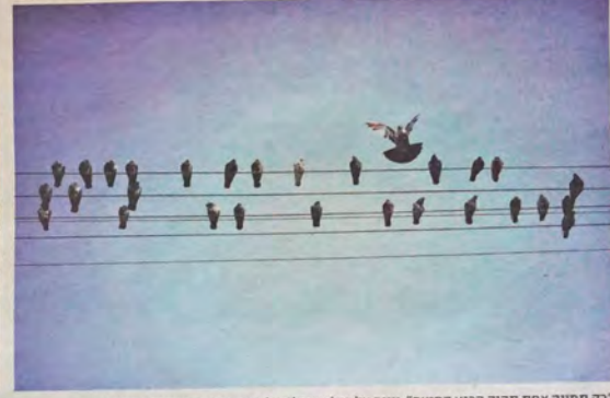
"רק תמונה אחת תהיה הרגע המנצח." יוניס על כבל חשמל