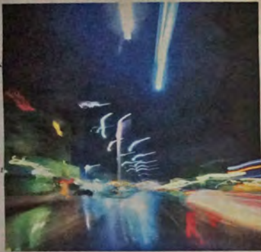
"בחזיתו להרכיב משקפיים ורוחיים"